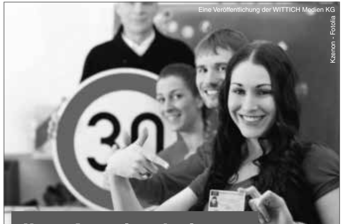
Eine Veröffentlichung der WITTICH Medien KG

Lokal informiert. Druck. Internet. Mobil.