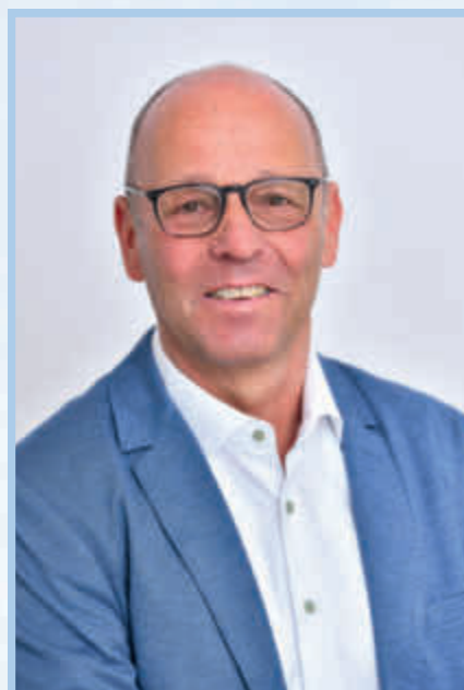
Gerd Kleinheinz Erster Bürgermeister