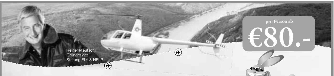
Reiner Meutsch, Gründer der Stiftung FLY & HELP

Anzeige online aufgeben anzeigen.wittich.de