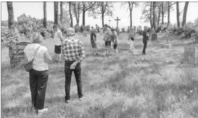
Besucher auf dem Friedhof Reußendorf.