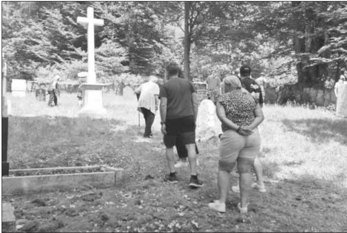
Besucher auf dem Friedhof Altglashütten. Im Hintergrund steht das neue Sandsteinkreuz.