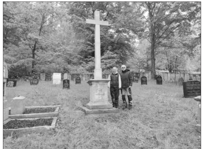
Geschafft: Denise Ullrich und Thomas Helfrich vor dem fertig aufgestellten Hochkreuz auf dem Friedhof Altglashütten.