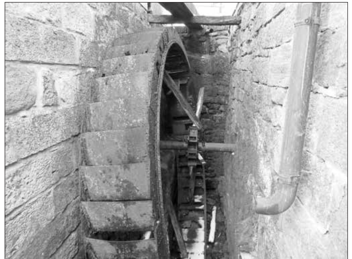
Das alte Mühlrad hat längst ausgedient.