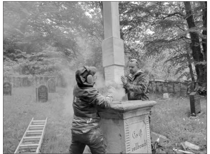
„Es ist vollbracht,“ steht auf dem Sockel des Hochkreuzes, der aus dem Jahr 1851 stammt.