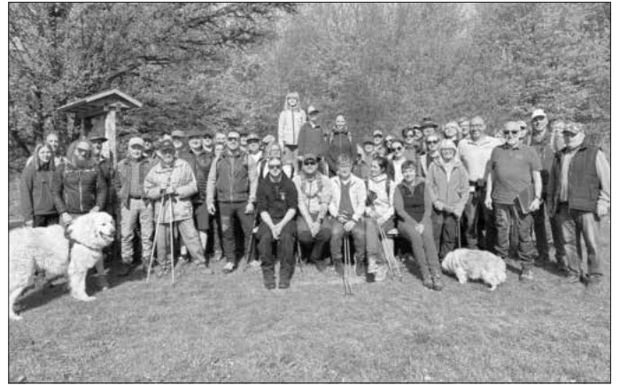
große Teilnehmerzahl bei der diesjährigen Grenzbegehung